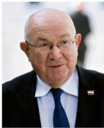
Mate Grančić u vrijeme Oluje bio je ministar vanjskih poslova