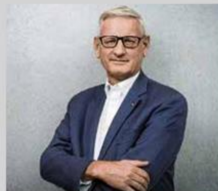
Carl Bildt bio je, tvrdi Mate Granić, agresivan i zločest nakon Oluje

"Svaki bi međunarodni promatrač bio protiv toga. Stoltenberg je bio plaćen za to da se stvari u Hrvatskoj rješavaju mirnim putem, bez rata. Stoltenberg je bio klasičan Skandinavac, odlično educiran, ali on se brinuo samo za jedno: da to (Granić ovdje misli na oslobađanje okupiranih područja u Hrvatskoj - op. aut.) bude mirnim putem i da ne dođe do vojne operacije. Ali on barem nije bio agresivan i nije bio zločest nakon Oluje, za razliku od, primjerice, Carla Bildta, mirovnog posrednika Europske unije za bivšu Jugoslaviju, inače Švedanina, koji je drugog dana Oluje, 5. kolovoza 1995., usporedio Tuđmana s Miloševićem, tako da sam ga ja, u posebnom priopćenju što sam ga sastavio bez prethodnog dogovora s predsjednikom Tuđmanom, proglasio personom non grata."