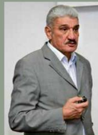
Interpretacija Davora Domazeta Loše puno je bliža onomu što tvrdi Vesna Škare Ožbolt nego tumačenju koje zastupa Mate Granić

Nije posve jasno, ili nije uopće jasno, čiji su pregovori u Ženevi bili ideja ili inicijativa - hrvatska (tj. Tuđmanova) ili Stoltenbergova ili, možda, neke treće ili četvrte strane. Mišljenja o tome su podijeljena