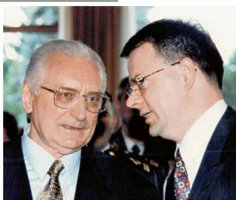
Tuđman je Pašalića detaljno i konkretno pripremio za hrvatsko-srpske pregovore u Ženevi

Čak i kod hrvatskih protagonistu Oluje imamo veliko nesuglasje ili čak posvemašniji razdor u interpretaciji one temeljne uzročno-posljedične linije koja vodi prema početku operacije Oluja (petak 4. kolovoza 1995. u 5 ujutro)